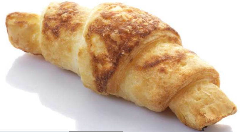
Croissant de queso Sin gluten