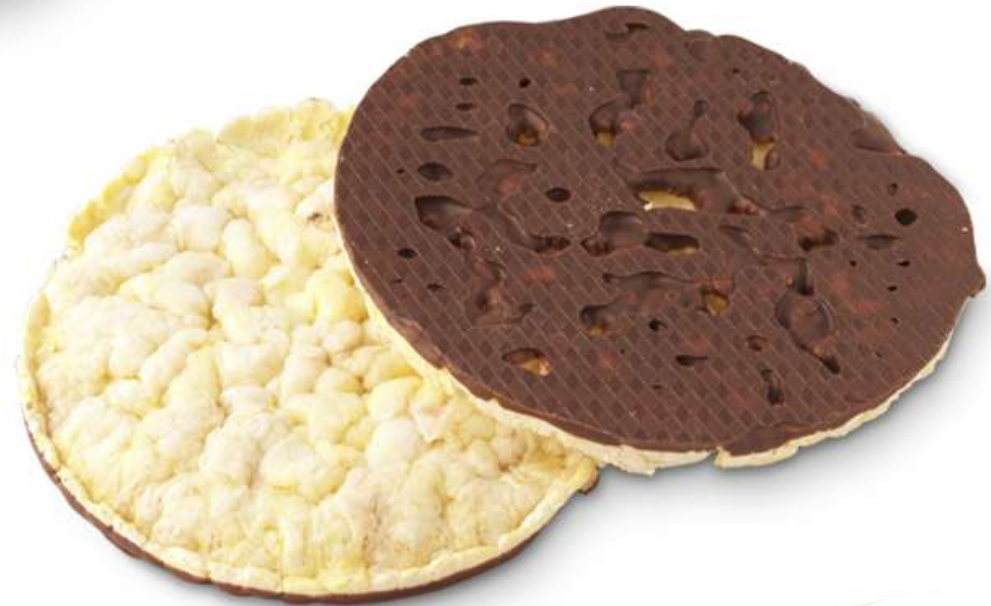
Tortitas de maíz con chocolate