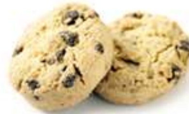
Mini Galletas con chispas de chocolate