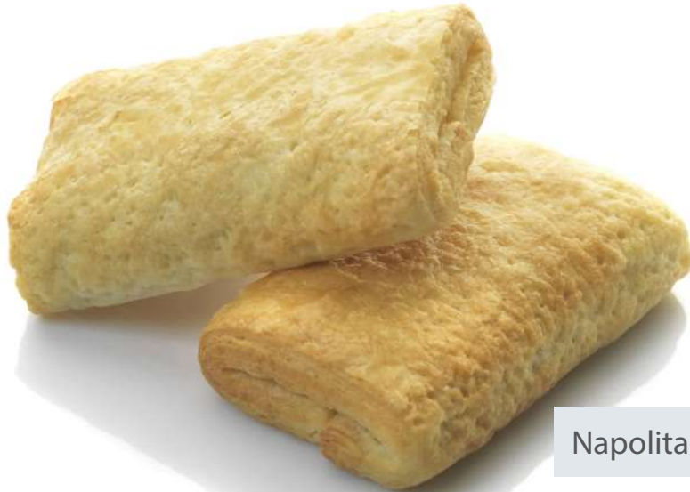
Napolitana de chocolate Sin gluten