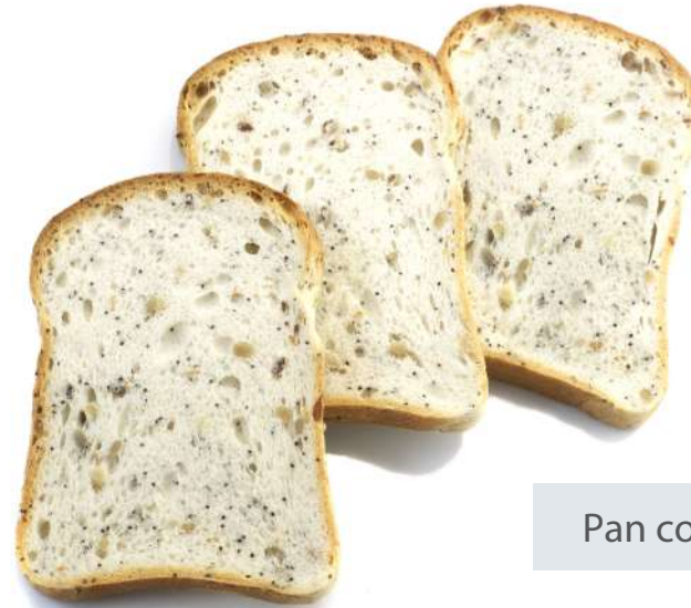
Pan con semillas