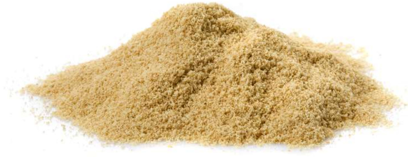
Maria Biscuit Crumbs