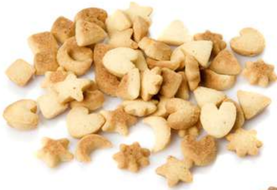
Mini formas de vainilla Sin gluten