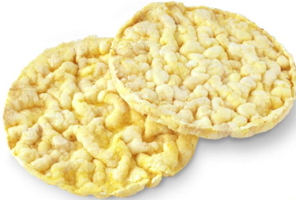
Tortitas de maíz