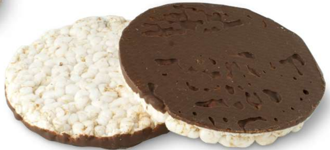
Tortitas de arroz con chocolate