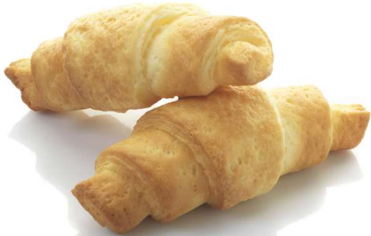
Croissant Sin gluten