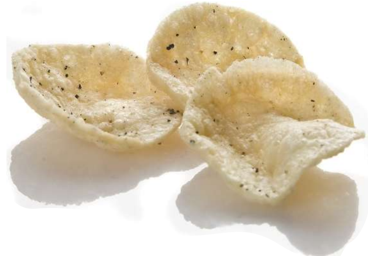
Pimienta Negra y Sal