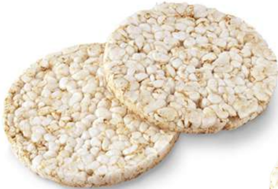
Tortitas de arroz