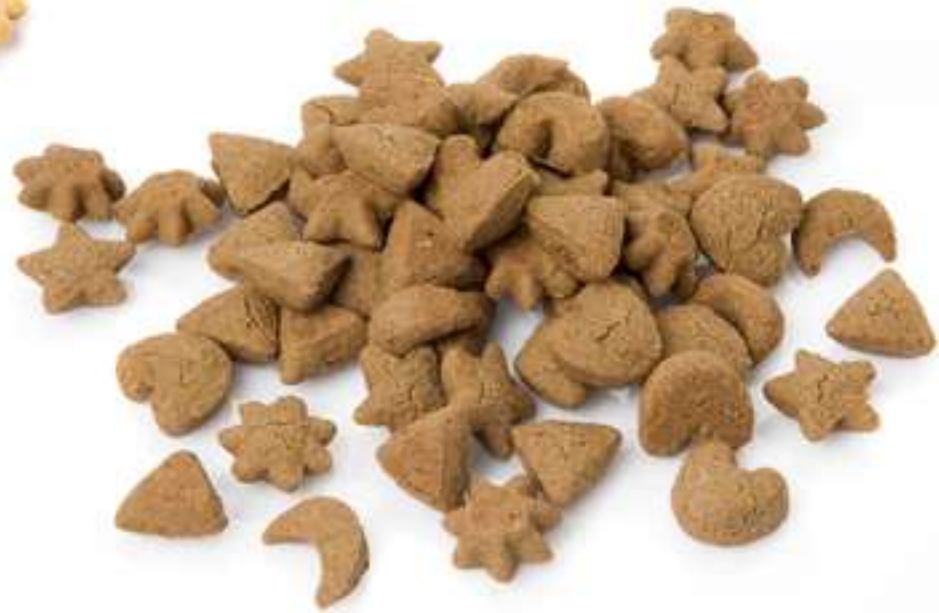
Mini formas de cacao Sin gluten